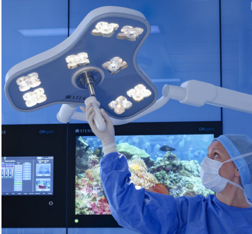
Kit de 5 poignées stérilisables