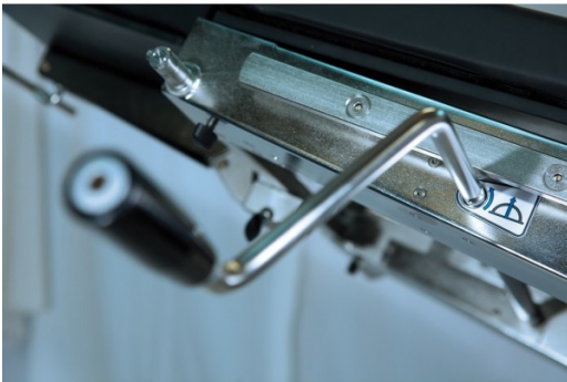
Manivelle pour billot (Easymax)