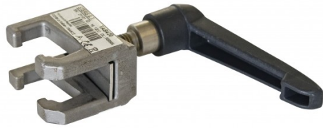
Bride Simple pour EU Rails